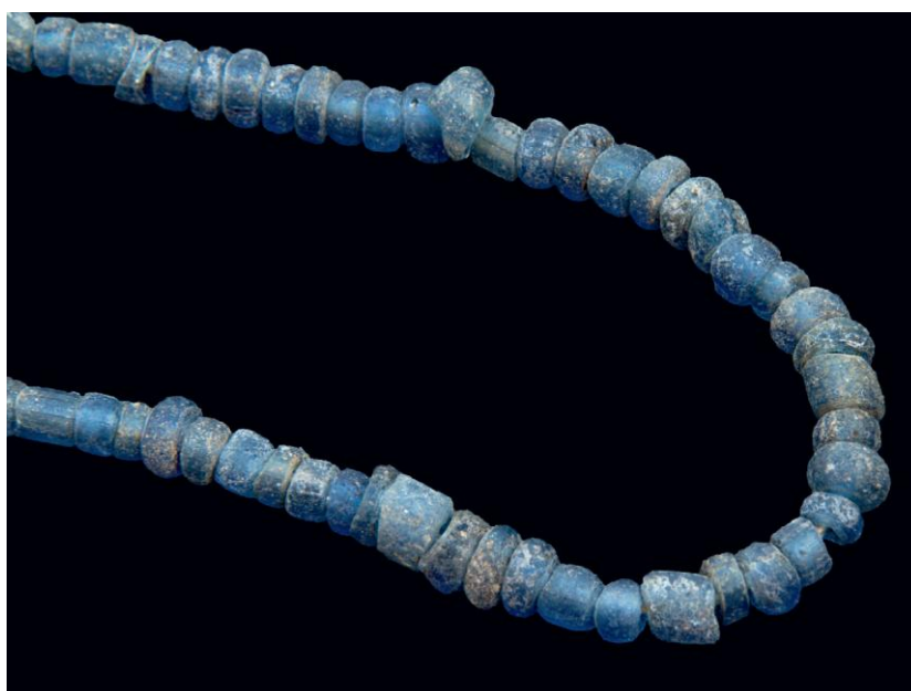
Paciorki z lapis lazuli z wczesnośredniowiecznego grobu komorowego 32/06

Publikacja książki nie zakończyła badań nad obydwoma cmentarzami, których ślady odsłoniliśmy na stanowisku 9 w Pniu. Nadal były prowadzone specjalistyczne studia i analizy pozyskanych wcześniej źródeł. A w drugiej połowie sierpnia 2022 roku, po 13 latach,