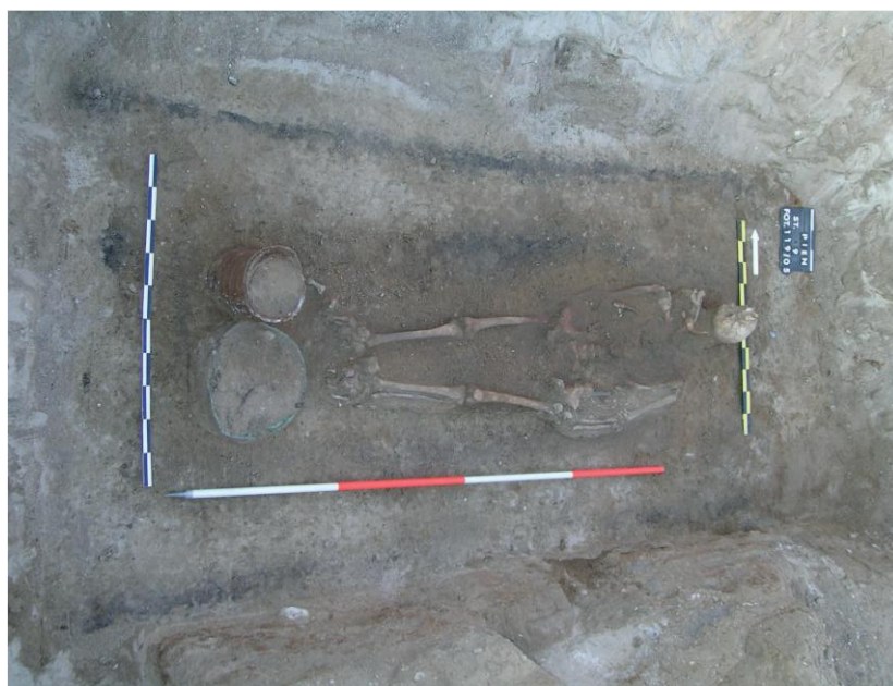
Wczesnośredniowieczny grób komorowy 15/05 z wiaderkiem i misą brązową zlokalizowanymi w pobliżu stóp

wkładanie monet do ust, umieszczenie w jamie grobowej kłódki, a także użycie kamieni w odpowiednich układach, m.in. wokół szyi zmarłej kobiety.