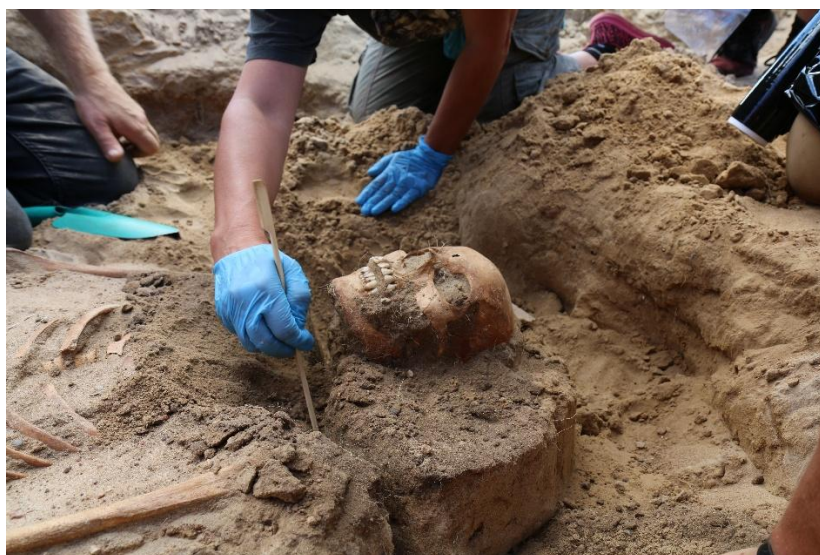
Grób 72/22 podczas eksploracji. Okolice czaszki po zdjęciu sierpa

taśmy wykonanej z nici jedwabnych w metalowym oplocie z połączanego srebra! W tym kontekście nie powinien dziwić zapewne staranny, pierwotny pochówek. Dziewczynę ułożono najprawdopodobniej w trumnie, w bogatym stroju, a jej głowa spoczęła na poduszce, której zarys odsłoniliśmy podczas eksploracji grobu 75. To zaskakuje w kontekście stwierdzonych praktyk antydemonicznych/antywampirycznych. A więc z jednej strony dowody na ogromny strach i obawę w postaci sierpa i kłódki mających zatrzymać w grobie tą młodą dziewczynę, zabezpieczając żywych przed jej działaniem, a z drugiej dowód na wysoki status społeczny tej osoby, na co bez wątplenia wskazuje pozostałość drogiej ozdoby nakrycia głowy (jedwab i połączone srebro). Jedwab w XVII wieku nadal był bardzo droгим materiałem, a tego rodzaju ozdoby nakryć głowy, analogiczne do stwierdzonej w grobie taśmy, spotkać można w grobach ówczesnych elit, nawet królewskich.