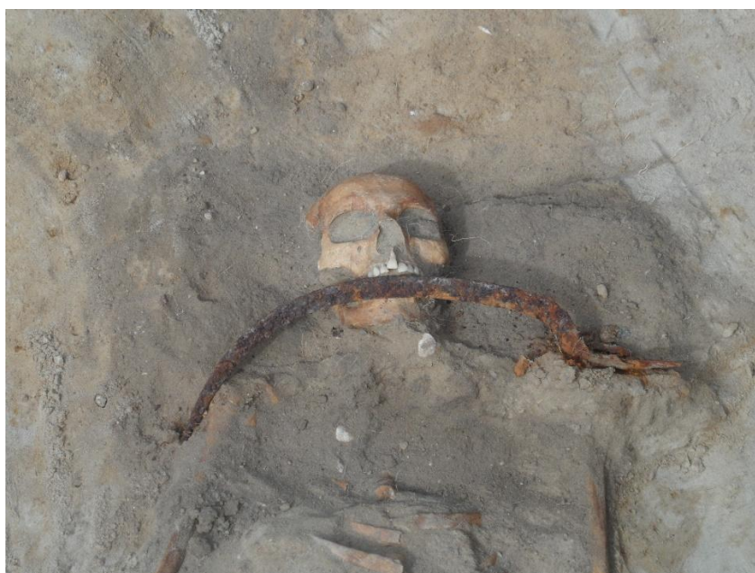
Grób 75/22 podczas eksploracji. Sierp skierowany w kierunku szyi pochowanej

Oczyszczaliśmy szkielet do dokumentacji i nagle w świetle słonecznym w okolicach czaszki zaczęło coś błyskać. Na czaszce i w jej okolicach znajdowały się delikatne „włókienka”. Na pewno metalowe, chyba srebrne – tak nam się wydawało. Pewnie część nakrycia głowy lub jego ozdoba. Ogląd makroskopowy i późniejsze analizy kostiumologiczne i metaloznawcze Marii Cybulskiej wykazały, że mamy do czynienia z ozdobą czepka w formie