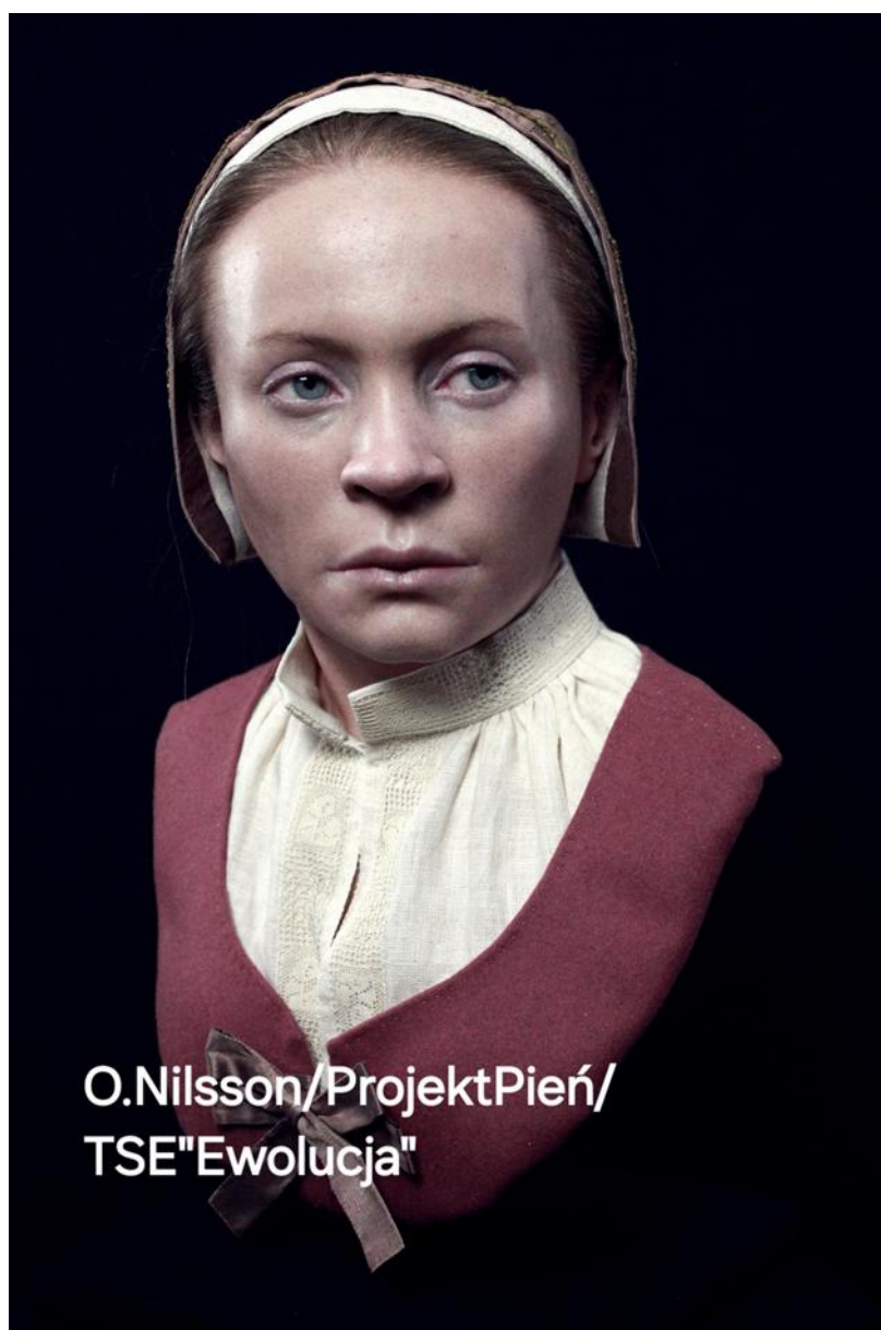
Popiersie Zosi wykonane przez Oscara Nilssona

Odkrycie pochówku Zosi poruszyło zarówno środowisko naukowe, jak i opinię publiczną. Znaleźisko stało się nie tylko przedmiotem badań, ale i źródłem głębokich emocji – od fascynacji, przez niepokój, aż po współczucie i refleksję nad ludzkim lękiem przed nieznanym. Fascynacja wynikała nie tylko z samego pochówku, ale i z możliwości poznawczych, które on dawał. Dzięki nowoczesnym technologiom, takim jak tomografia komputerowa, druk 3D oraz analizy izotopowe i genetyczne, możliwe stało się odtworzenie twarzy Zosi. W projekt zaangażowaliśmy Oscara Nilssona – szwedzkiego archeologa i artystę, znanego z realistycznych rekonstrukcji fizjonomii postaci historycznych. Rekonstrukcja twarzy