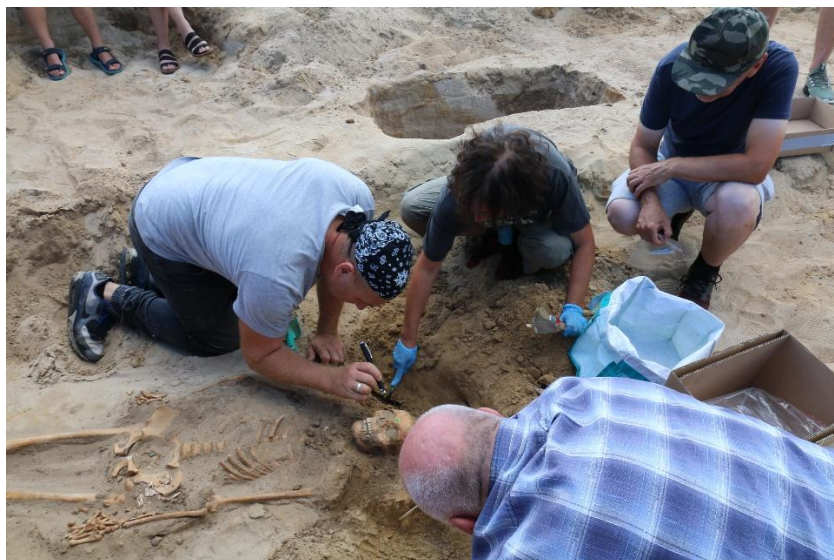
Grób 75/22 podczas eksploracji

ubioru z epoki przez Annę Silwerulv z Vasamuseet. Wówczas, podczas eksploracji grobu, myślałem o rekonstrukcji cyfrowej.