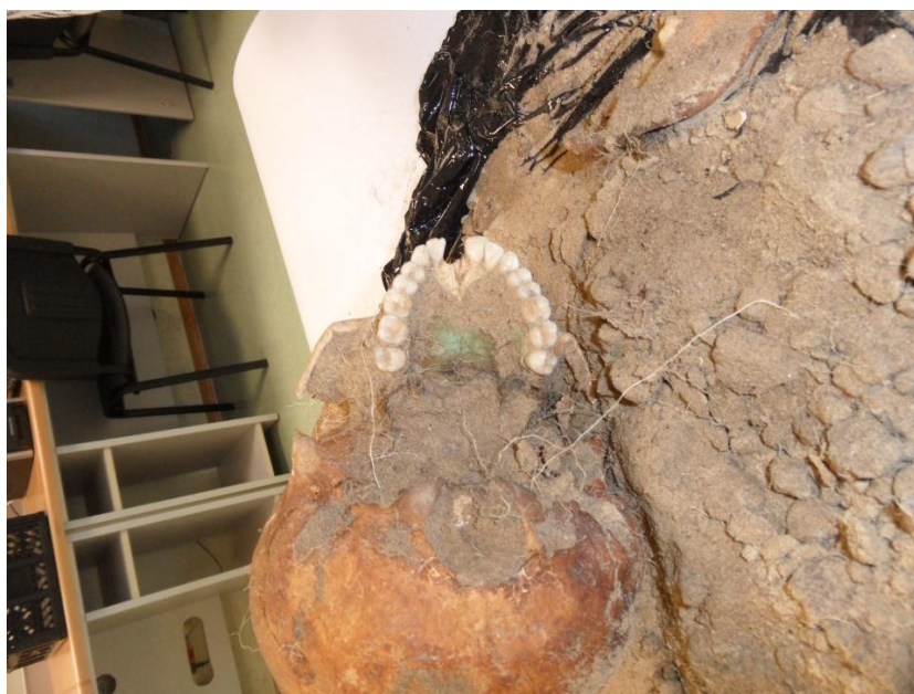
Oczyszczanie czaszki w gabinecie Instytutu Archeologii UMK w Toruniu

monetę, w przypadku zabezpieczenia przed zmarłym monety wkładano zazwyczaj pod język, a ewentualne przebarwienia dotyczyły zazwyczaj żuchwy. Poza tym monety nie było! Nie mogła się przecież rozpuścić. Wiemy natomiast, że koncentracja przebarwienia znajduje się przy gardle i przechodzi na podstawę czaszki i dwa pierwsze kręgi szyjne. To tak jakby tej młodej kobiecie wciśnięto coś do gardła, coś co zawierało między innymi miedź. Skład pierwiastkowy tego przebarwienia jest znany – wykonano analizę metodą rentgenowskiej makrofluorescencji w Interdyscyplinarnym Centrum Nowoczesnych Technologii UMK. Badania trwają i być może dowiemy się co było przyczyną tego przebarwienia.