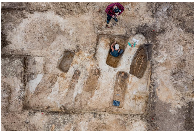
2022 rok. Cmentarzisko nowożytnie w Pniu podczas eksploracji grobów

wznowiono archeologiczne badania ratownicze w Pniu. Prace przeprowadziła ekspedycja Instytutu Archeologii Uniwersytetu Mikołaja Kopernika w Toruniu, przy wsparciu pracowników Wydziału Archeologii Uniwersytetu Warszawskiego. W pracach terenowych pomagali też studenci, wolontariusze, a także członkowie Toruńskiego Stowarzyszenia Edukacyjnego „Ewolucja”, Kujawsko-Pomorskiej Grupy Poszukiwaczy Historii i mieszkańcy gminy Dąbrowa Chełmińska. Badania zostały sfinansowane ze środków Europejskiej Fundacji „Pamięć i Dziedzictwo”, która otrzymała na ten cel grant od Gminy Dąbrowa Chełmińska, oraz Uniwersytetu Mikołaja Kopernika w Toruniu.