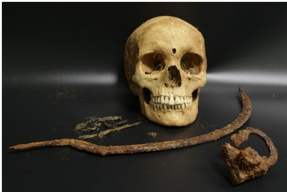
Czaszka kobiety z grobu 75/22 oraz sierp, kłódka i jedwab

Dlaczego w ogóle naruszono ten grób i co chciano zrobić nie da się dokładnie ustalić. Najprawdopodobniej dalej obawiano się pochowanej już młodej kobiety lub obwiniono ją o jakieś nieszczęście, które spotkało miejscową ludność. A wiek XVII to wiek wojen, walk religijnych, epidemii oraz surowego klimatu (tzw. mała epoka lodowcowa), a więc o nieszczęście, śmierć nie było trudno. Może być z tym związana także przyczyna śmierci tej dziewczyny, której obecnie nie jesteśmy w stanie określić. Szkielet z grobu 75 jest kompletny i nic nie wskazuje na nagłe pozbawienie życia. Przeprowadzono też szereg analiz i konsultacji medycznych, które wykazały co prawda patologie, a nawet nowotwór (naczyniak w trzonie mostka, który mógł powodować deformacje i ból), jednak nie one były przyczyną śmierci. Może więc nieszczęśliwy przypadek, na przykład utonięcie, a może otrucie? Może ją skrzywdzono i zamordowano? Także wygląd, czy sposób zachowania, w tym objawy choroby, mogły powodować, że tamtejsza ludność uznała ją za zagrożenie i obawiała się jej. Pamiętajmy, że XVII wiek to czas zabobonów, ludzie wierzyli w wiedźmy, wampiry, strzygi i inne demony.