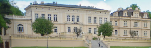
Zespół pałacowy Ostromecko